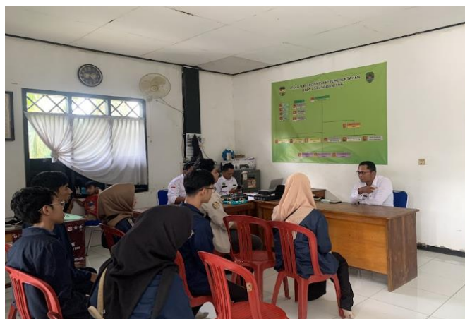
Gambar 2. Wawancara dengan Kepala Desa Parungbanteng

Gambar 1 dan 2 merupakan dokumentasi wawancara pendahuluan tim pengabdian dengan mitra pemerintahan daerah setempat yaitu kepala desa Parungbanteng dan BUMDES yang merupakan tahap kegiatan base-line kegiatan berdasarkan existing condition dari mitra.