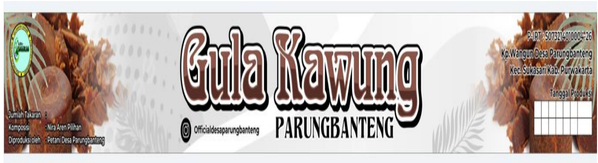
Gambar 8. Desain Label Terbaru untuk Produk Gula Kawung