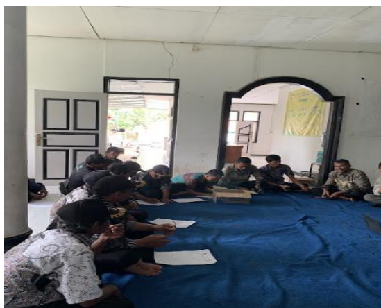
Gambar 7b. Pelatihan inovasi label kemasan kepada mitra