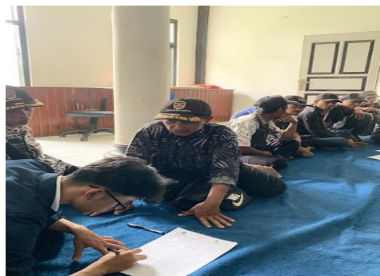
Gambar 7a. Pendampingan Pengumpulan Berkas