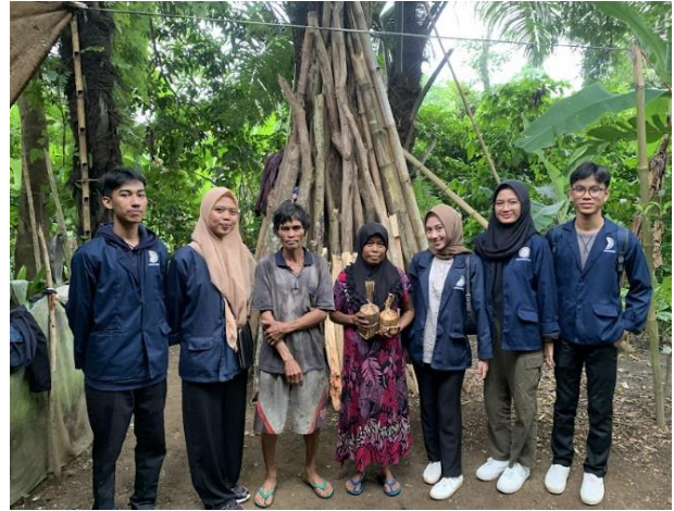
Gambar 4. Wawancara dengan mitra penghasil Gula Kawung