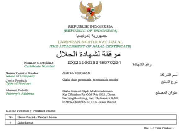
Gambar 12. Sertifikasi halal Produk Gula semut