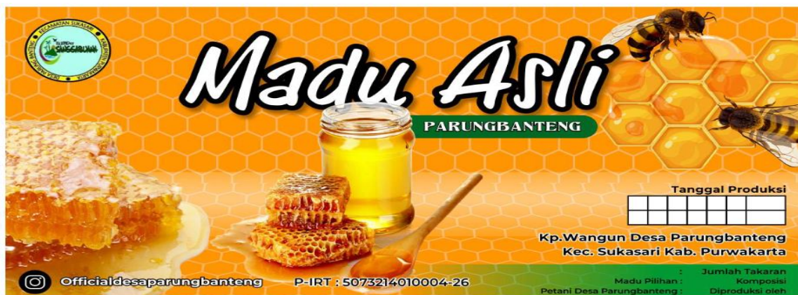
Gambar 10. Desain Label Terbaru untuk Produk Madu Hutan