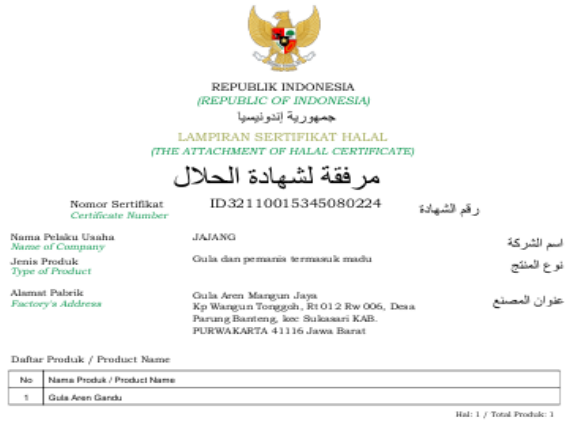
Gambar 11. Sertifikat halal Produk Gula Kawung