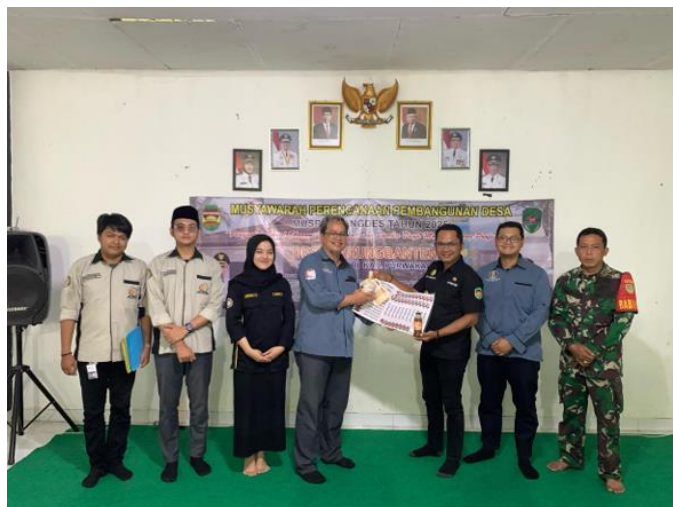
Gambar 14. Penyerahan Label dan Sertifikasi Halal Kepada Mitra