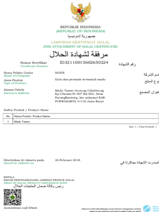
Gambar 13. Sertifikasi Halal Produk Madu Hutan