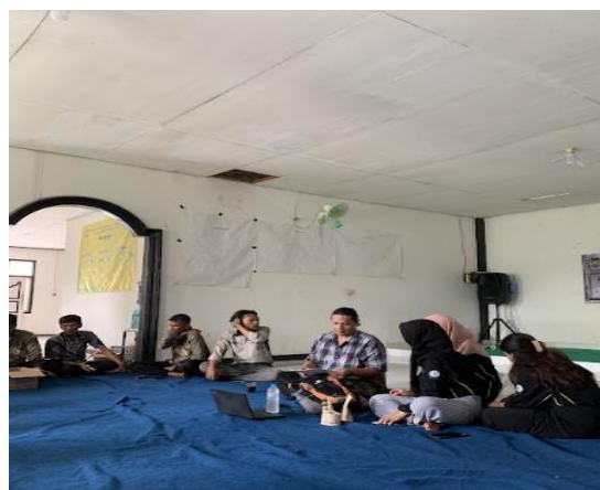
Gambar 7c. Pelatihan inovasi label kemasan kepada mitra