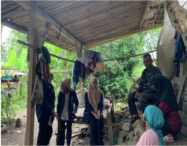
Gambar 3 Wawancara dengan mitra produk Madu asli