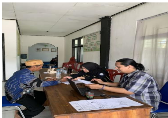
Gambar 6. Pendampingan Pengajuan Sertifikasi Halal