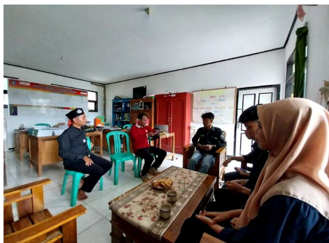
Gambar 1. Wawancara Awal dengan Pihak BUMDES Parungbanteng