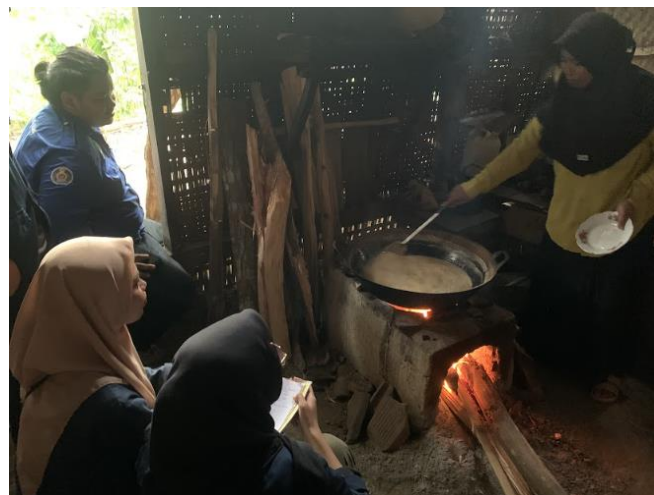
Gambar 5. Wawancara dengan mitra penghasil gula semut