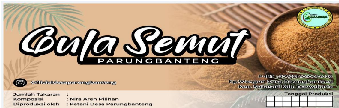
Gambar 9. Desain Label Terbaru untuk Produk Gula Semut