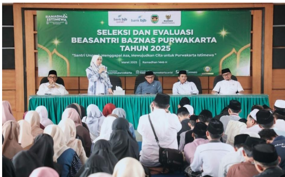
Gambar. 1. Pembukaan Acara Beasantry

Kegiatan pengembangan instrumen asesmen kemampuan baca kitab kuning bagi santri penerima beasiswa BAZNAS Purwakarta diawali dengan acara pembukaan resmi. Pembukaan kegiatan ini merupakan tahap penting yang menandai dimulainya seluruh rangkaian program dan menjadi sarana sosialisasi tujuan, ruang lingkup, serta manfaat kegiatan kepada seluruh pemangku kepentingan. Acara ini dihadiri oleh perwakilan BAZNAS Kabupaten Purwakarta, unsur Pemerintah Daerah Purwakarta, dan Kementerian Agama Kabupaten Purwakarta, serta para santri penerima manfaat dan tim pelaksana program. Kehadiran para pemangku kebijakan tersebut menunjukkan adanya dukungan institusional yang kuat terhadap upaya peningkatan kualitas sumber daya santri melalui pendekatan asesmen terstandar.