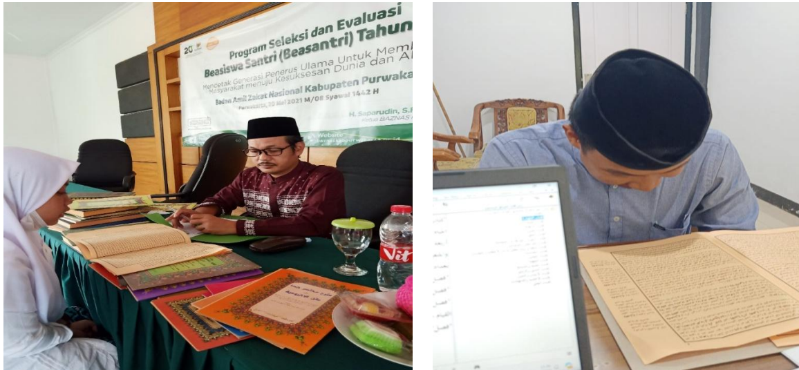
Gambar. 3. Tahapan Seleksi