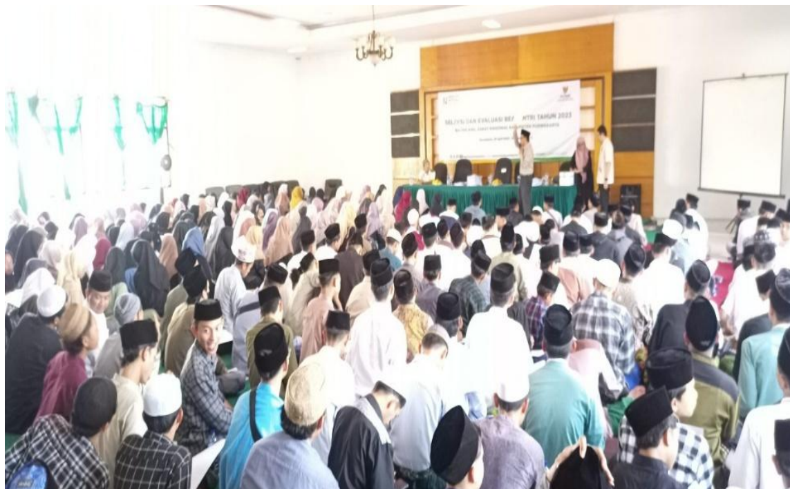
Gambar. 2. Sosialisasi Program

untuk menjadikan program Beasantri sebagai model pemberdayaan pendidikan pesantren yang transparan, terukur, dan berkelanjutan. Acara pembukaan juga menjadi momentum untuk memperkuat sinergi antara lembaga zakat, pemerintah, dan lembaga pendidikan Islam dalam meningkatkan kualitas literasi kitab kuning dan kompetensi akademik santri.