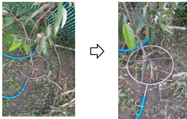
Gambar 3 Uji Coba Drp Irrigation