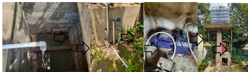
Gambar 1 Instalasi Pemipaan dari Sumur ke Torn Primer.

Data yang dikumpulkan oleh sistem IoT mencakup suhu dan kelembaban udara, kelembaban tanah, nilai EC dan pH larutan nutrisi, serta volume air yang digunakan. Semua data ini ditampilkan secara real-time pada dashboard yang dapat diakses melalui smartphone atau komputer, memungkinkan petani untuk memantau kondisi tanaman dari jarak jauh dan melakukan penyesuaian parameter sistem jika diperlukan [6].