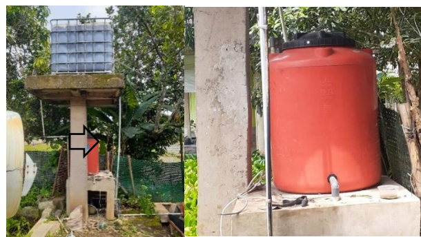
Gambar 2 Pendistribusian Air dari Torn Primer ke Torn Sekunder