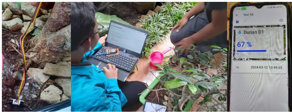
Gambar 5 Instalasi IoT Pada Tanaman anggur