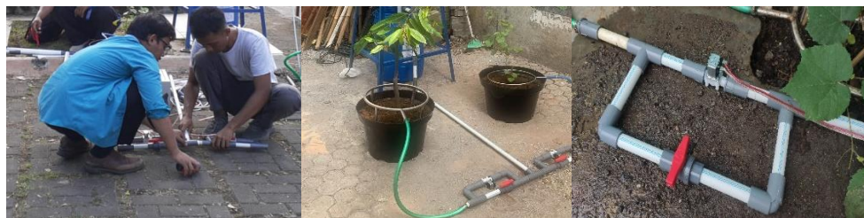
Gambar 4 Instalasi Penyiraman Secara Otomasi Berdasarkan Timer